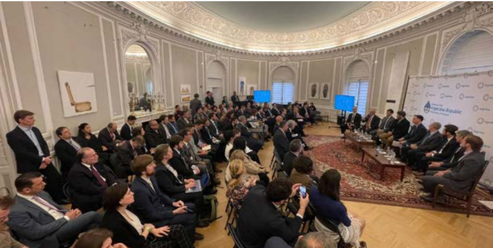
Día Argentino del Espacio en la Embajada.