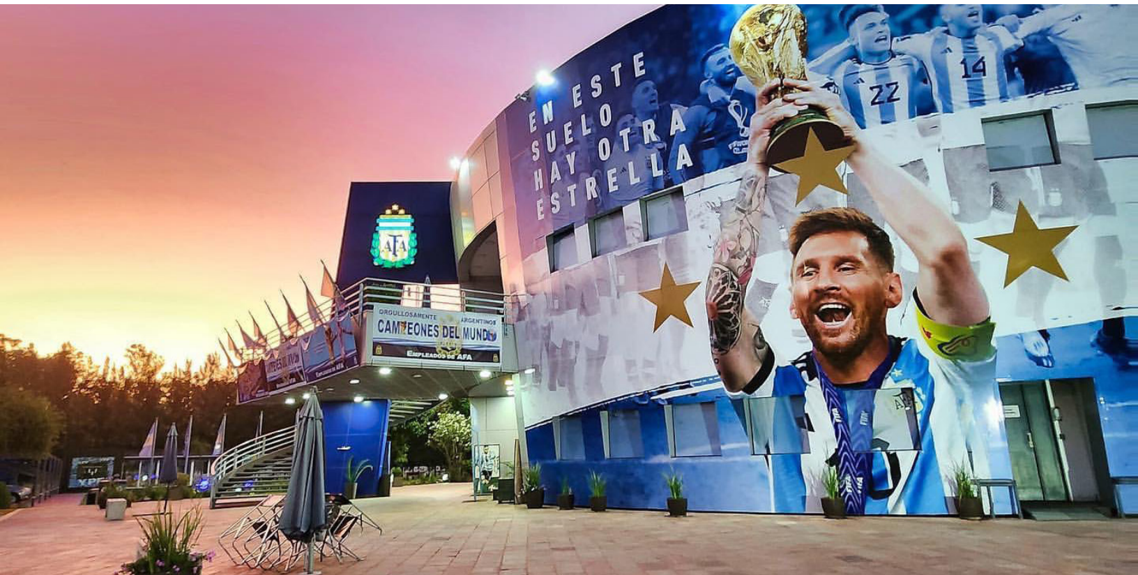
Predio de la AFA, Ezeiza.