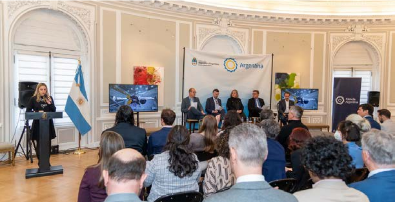
Desayuno de networking, en la Embajada Argentina