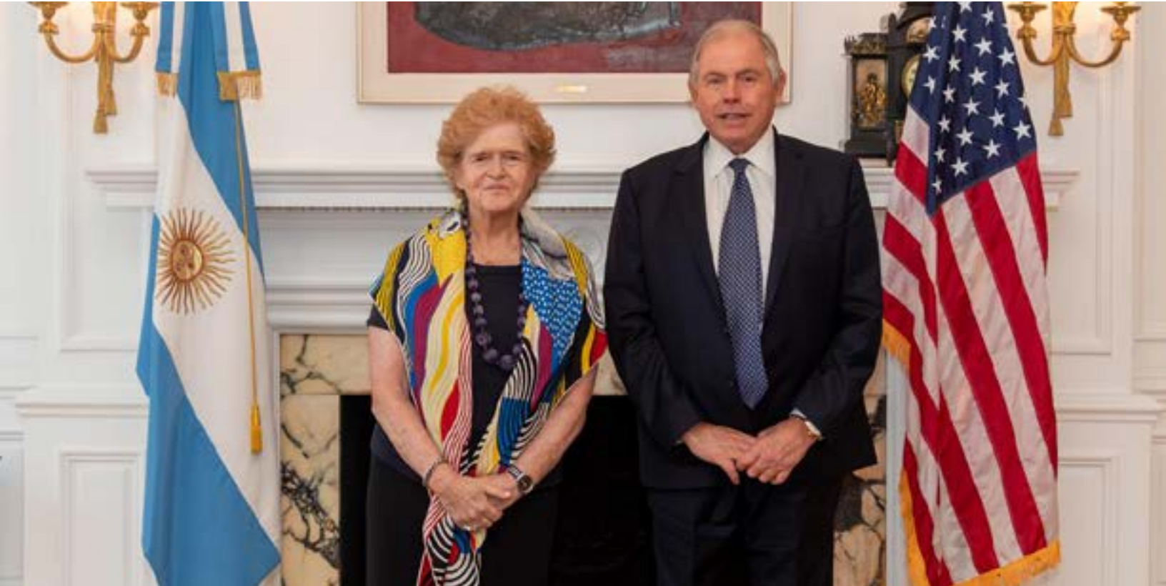
El embajador Gerardo Werthein con la embajadora Deborah Lipstadt.