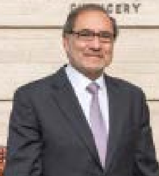
Jorge Argüello Embajador en los Estados Unidos