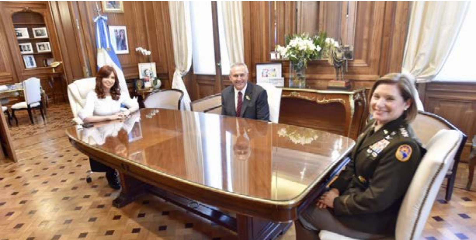
Vicepresidenta Cristina Fernández de Kirchner (izq.), Embajador Marc Stanley (centro), Generala Laura Richardson (der.)